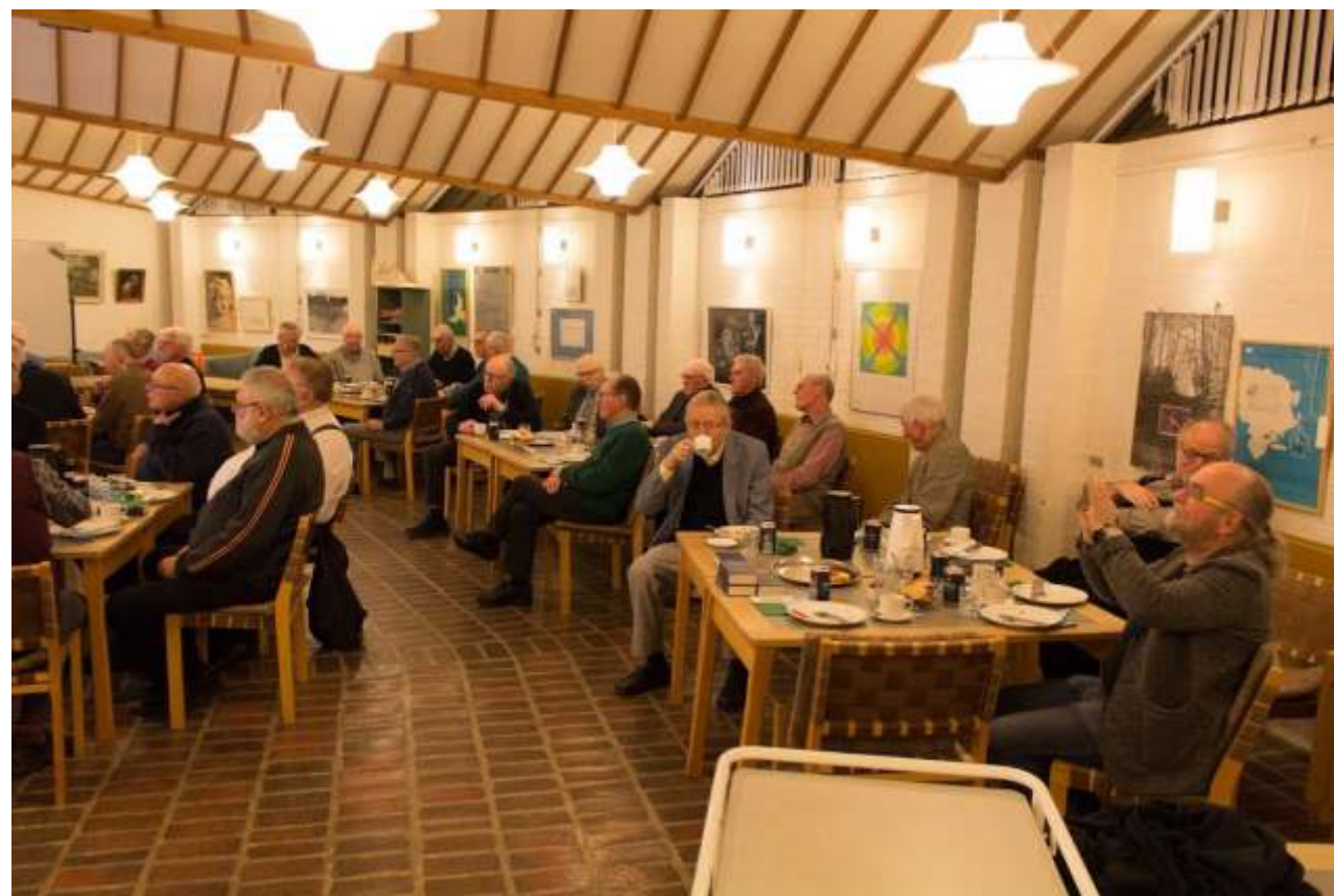
Motiv fra en klassisk mandsklub-aften!