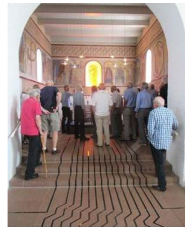
Fra mandsklubbens udflugt til Jelling

foredragsholder, der i øvrigt ikke modtager honorar. Efter foredraget sluttes der af med en salme eller aftensang. Der betales ikke kontingent eller indskud til klubben.